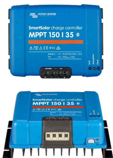
Controlador de carga SmartSolar MPPT 150/35